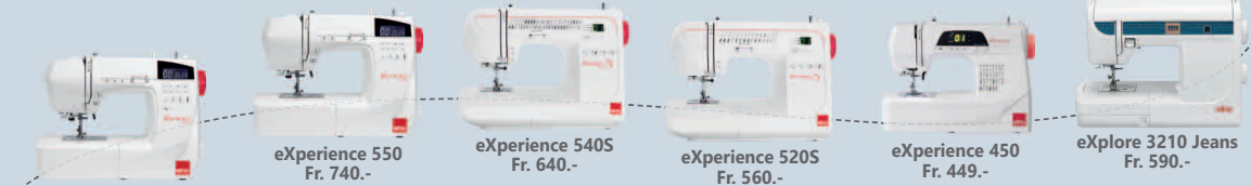
eXperience 560 Fr. 799.- eXperience 550 Fr. 740.- eXperience 540S Fr. 640.- eXperience 520S Fr. 560.- eXperience 450 Fr. 449.- eXplore 3210 Jeans Fr. 590.-