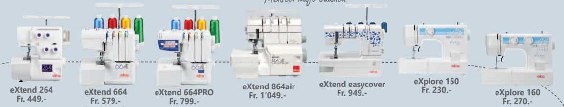
eXtend 264 Fr. 449.- eXtend 664 Fr. 579.- Sonderpreis Fr. 479.- eXtend 664PRO Fr. 799.- eXtend 864air Fr. 1'049.- eXtend easycover Fr. 949.- eXplore 150 Fr. 230.- eXplore 160 Fr. 270.-