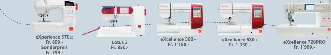
eXperience 570α Fr. 899.- Sonderpreis Fr. 799.- Lotus 2 Fr. 850.- eXcellence 580+ Fr. 1'150.- eXcellence 680+ Fr. 1'350.- eXcellence 720PRO Fr. 1'999.-